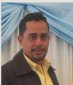
Jorge L. Álvarez @jorgealvarezv